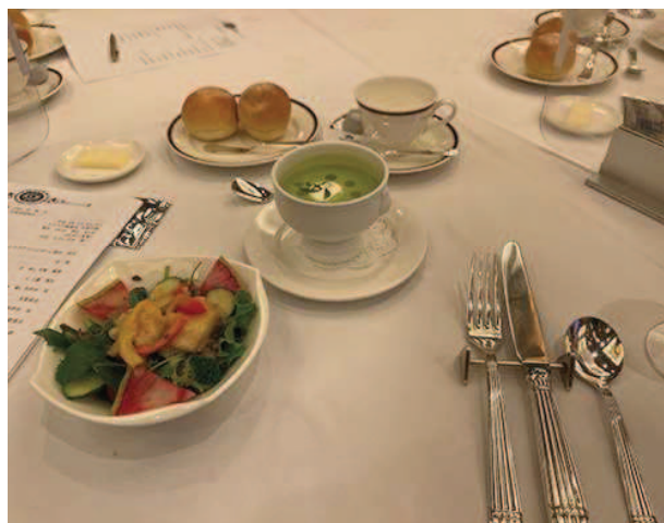
本日のホテル日航のお食事