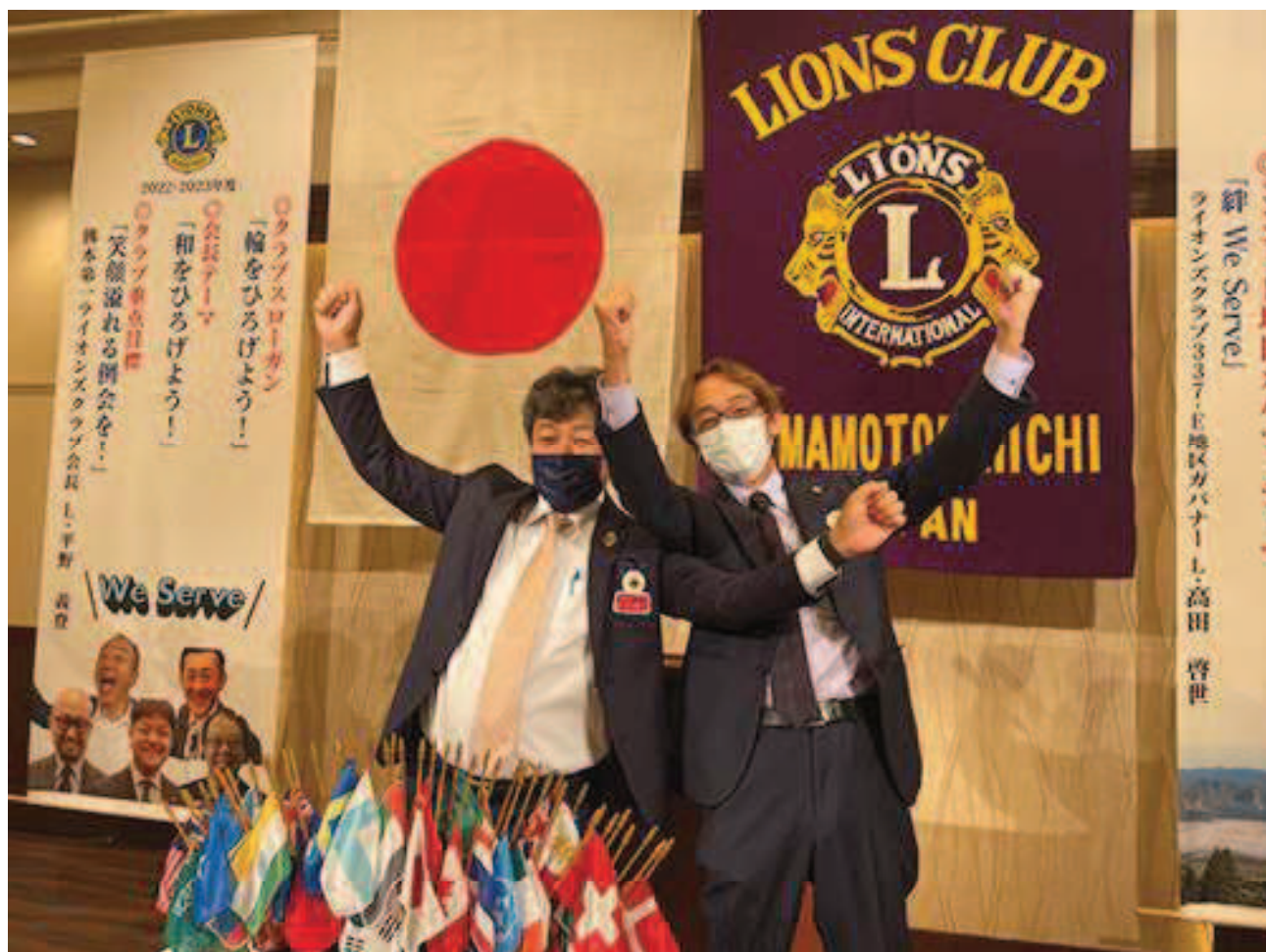
同級生（幼馴染）のロアは息を揃えて