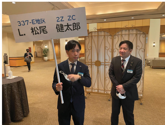
L 松尾ゾーンチェアパーソン (入場前の緊張)